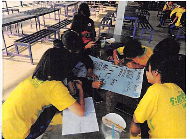
ขั้นค้นคว้าและคิด