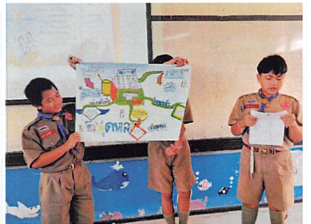
ขั้นนำเสนอผลงาน