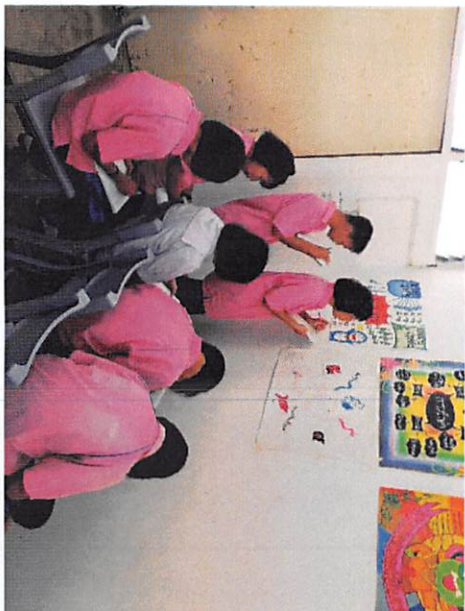
ชั้นประถมศึกษา