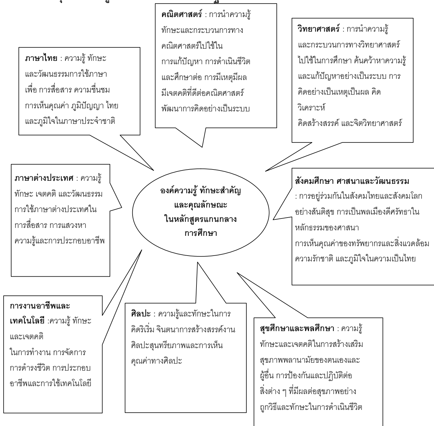
ภาพ 3 แสดงคุณภาพของผู้เรียนระดับการศึกษาขั้นพื้นฐาน