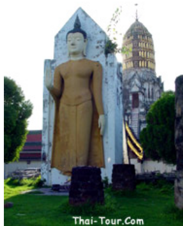
ภาพที่ 3 พระอัฐสารและวิหารเก่าแกในวัดพระศรีรัตนมหาธาตุ