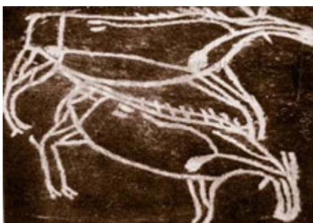
ภาพที่ 2 จิตรกรรมฝาผนังถ้ำผีหัวโต จังหวัดกระบี่ เป็นภาพคนพรางตัวเป็นสัตว์ชนิดหนึ่ง

จิตรกรรมฝาผนังที่สร้างสรรค์ไว้ในผนังถ้ำเป็นงานที่สะท้อนถึงวิถีชีวิตของกลุ่มชนนั้นๆ และจินตนาการของจิตรกร ประเทศไทยได้มีการค้นพบแหล่งศิลปะถ้ำเมื่อปี พ.ศ. 2446 จนถึงปี พ.ศ. 2536 เป็นของสมัยก่อนประวัติศาสตร์ 149 แห่ง จิตรกรรมฝาผนังถ้ำในประเทศไทย เป็นภาพที่สื่อความหมายได้อย่างชัดเจน เช่นภาพคนแสดงการต่อสู้กับสัตว์ หรือการออกล่าสัตว์ในสมัยนั้น เช่น จิตรกรรมฝาผนังถ้ำผีหัวโต จังหวัดกระบี่ จิตรกรรมฝาผนังถ้ำเขาปลาร้า จังหวัดอุทัยธานี