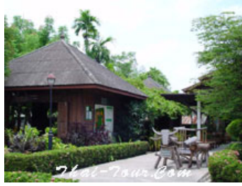
ภาพที่ 5 พิพิธภัณฑสถานพื้นบ้านจันทวี