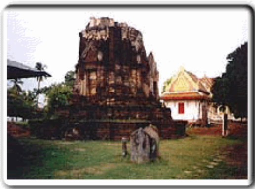
ภาพที่ 4 พระปรางค์วัดจุฬามณี

พระปรางค์ตั้งอยู่บริเวณกึ่งกลางกำแพงแก้ว พระปรางค์พระประธานของวัดจุฬามณีมีลักษณะทางสถาปัตยกรรมและศิลปะที่จัดว่ามีความงดงามดีเด่นที่สุดแห่งหนึ่งในประเทศไทย เพราะมีรูปแบบและแผนผังไม่เหมือนพระปรางค์ทั่วไปในประเทศไทย ลวดลายปูนประดับองค์พระปรางค์มีความสวยงามและมีคุณค่าที่สุด