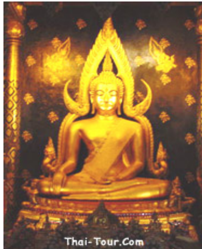
ภาพที่ 2 พระพุทธชินราช