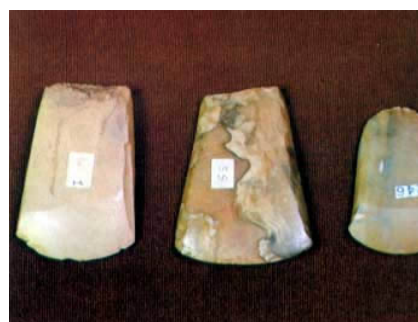
ภาพที่ 4 เครื่องมือล่าสัตว์สมัยยุค