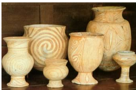
ภาพที่ 3 ภาพแกะเครื่องปั้นดินเผาลายเขียนสี หินสมัยก่อนประวัติศาสตร์ ขุดพบที่ บ้านเชียง จังหวัดอุดรธานี

ที่มา : ปัญญา ทรงเสรีย์ และเศรษฐศิริ สายกระสุน .จิตรกรรม1,วัฒนาพานิช,2542,หน้า 8.