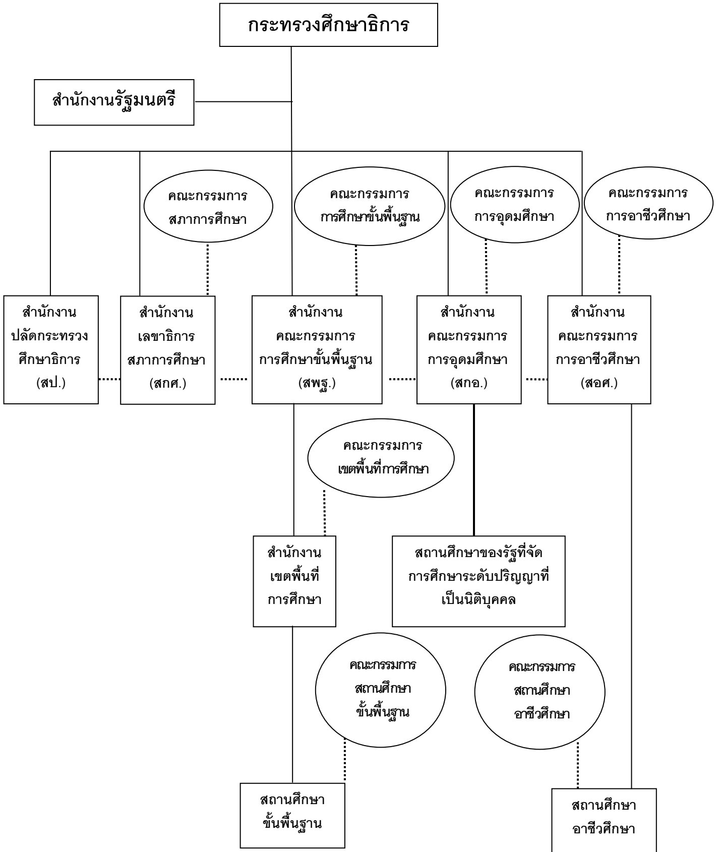
ภาพ 1 โครงสร้างการบริหารจัดการศึกษาของกระทรวงศึกษาธิการ