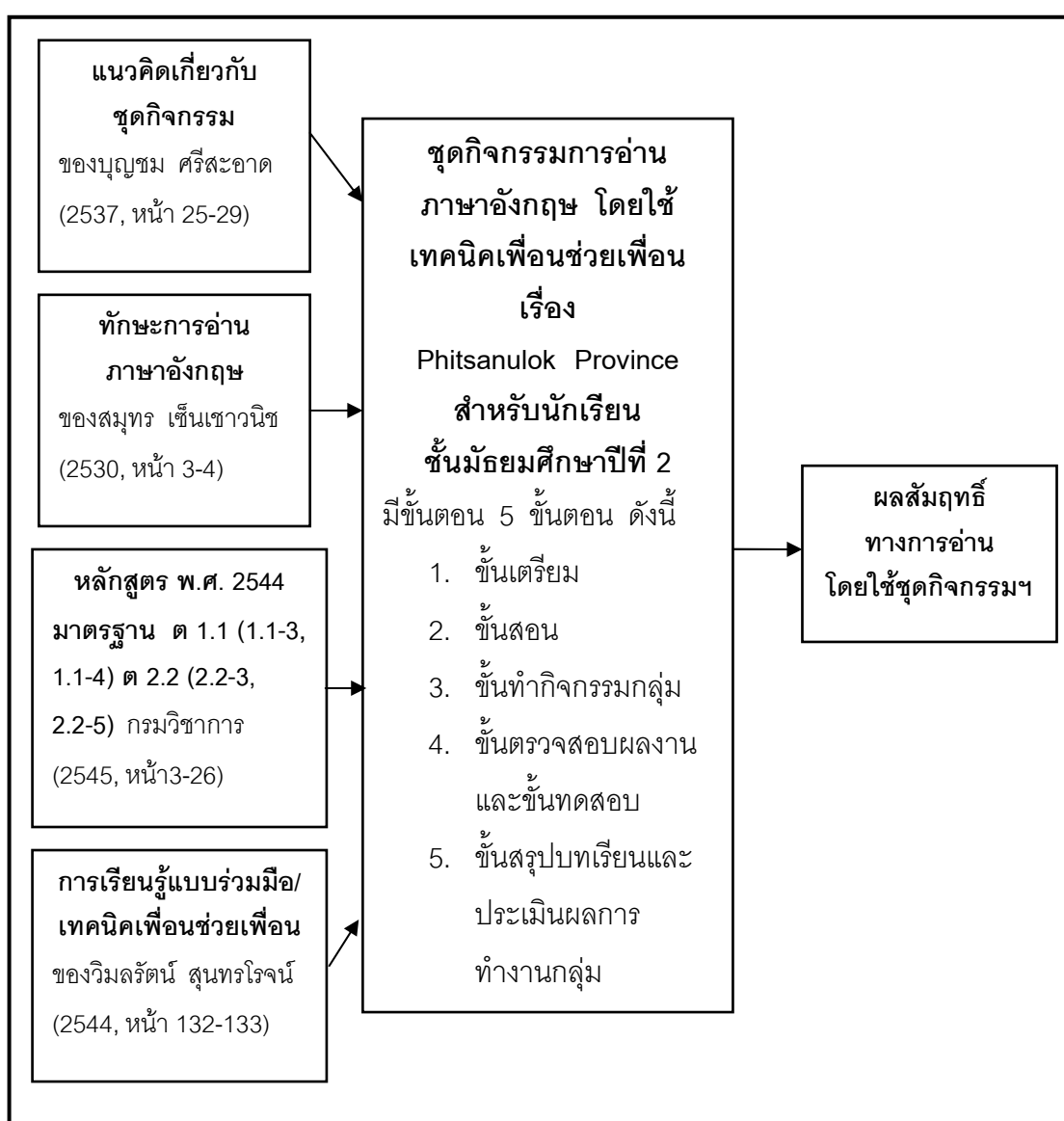
ภาพ 2 กรอบแนวคิดในการวิจัย

ในการพัฒนาชุดกิจกรรมการอ่านภาษาอังกฤษ โดยใช้เทคนิคเพื่อนช่วยเพื่อน เรื่อง Phitsanulok Province สำหรับนักเรียนชั้นมัธยมศึกษาปีที่ 2 ผู้วิจัยมีกรอบแนวคิดในการดำเนินการวิจัยดังต่อไปนี้